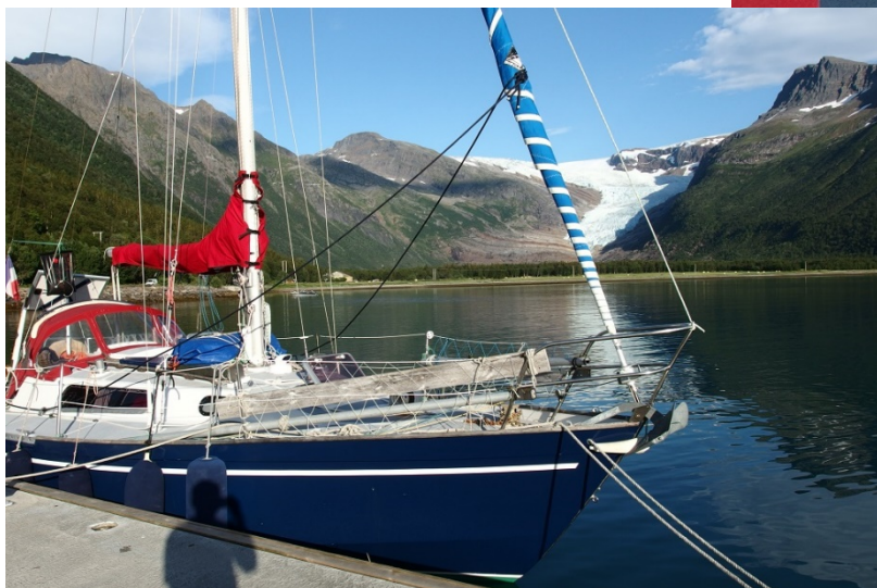
Devant le glacier Svartisen