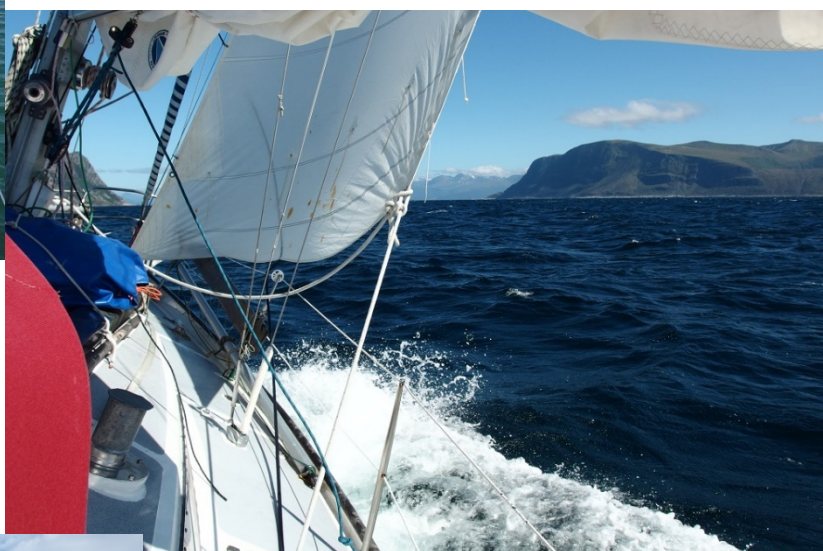
Arrivée sur la Norvège juin 2018