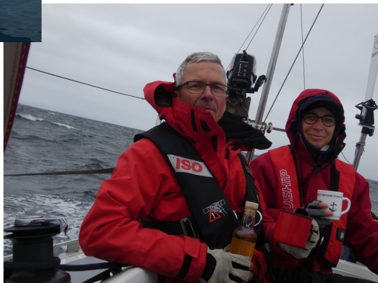
Passage du cercle polaire, arrosé à l'aquavit Juillet 2018