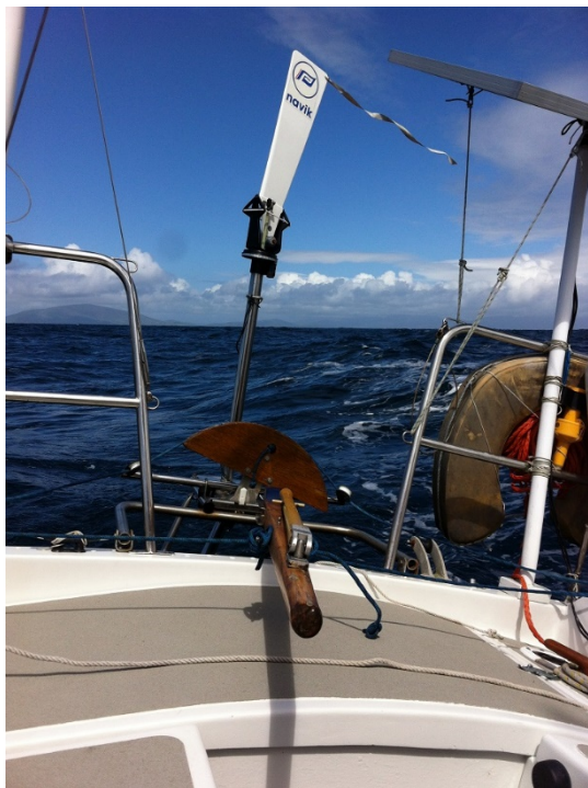
Le régulateur Navik barre le plus souvent